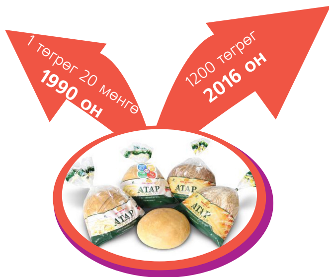
Зураг 2. Талхны үнийн өсөлт

Гэхдээ инфляцийг зөвхөн нэг барааны үнийн өсөлтөөр биш нийт бараа, үйлчилгээний үнийн дундаж түвшний өсөлтөөр хэмжинэ. Бүх бараа, үйлчилгээний үнийн өөрчлөлтийг улсын хэмжээгээр нэг бүрчлэн хэмжих боломжгүй.