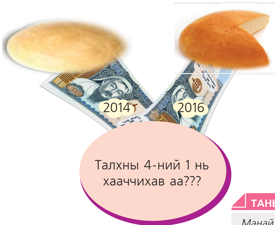
Зураг 3. Нэг мянган төгрөгийн худалдан авах чадвар

Жишээ нь: Инфляци 25 хувиар өсөхөд 1000 төгрөгийн худалдан авах чадвар 25 хувиар буурна. Үүнийг талхаар зүйрлэн харуулъя