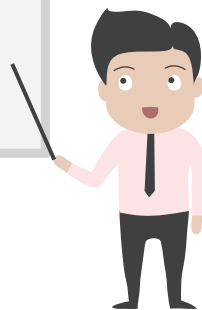
Зураг 4. Валютын ангилал

Валют: Гадаад, дотоод төлбөр тооцоонд хэрэглэгдэж байгаа аль нэг улсын мөнгөн тэмдэгтийг хэлнэ.